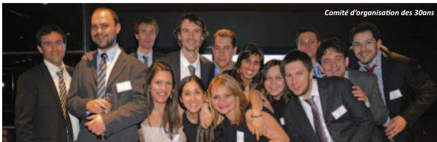
Comité d'organisation des 30ans