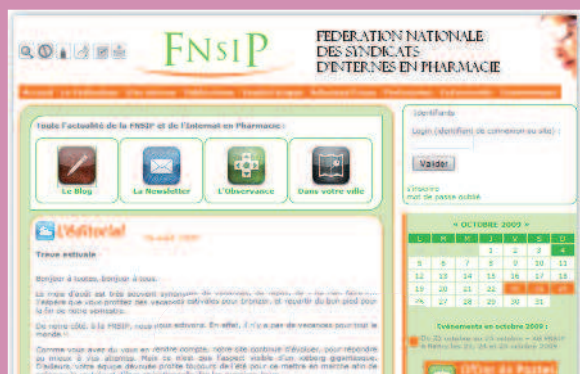
Jusqu'à novembre 2009

conception en parallèle d'une mouture adaptée exclusivement aux navigateurs mobiles (iPhone, smartphones...) mais aussi la révision de l'identité visuelle qui n'a pas trouvé d'écho en pratique. Parmi les chantiers à méditer : la création d'une plateforme de partage de documents (diaporamas, brochures, mémoires,...) et de suggestions de liens, directement depuis le site de la FNSIP. L'incorporation de l'identification sur le site exclusivement via Facebook avait été expérimentée lors de la conception, mais abandonnée à l'époque à cause des blocages d'accès aux sites communautaires imposés par certains sites hospitaliers !