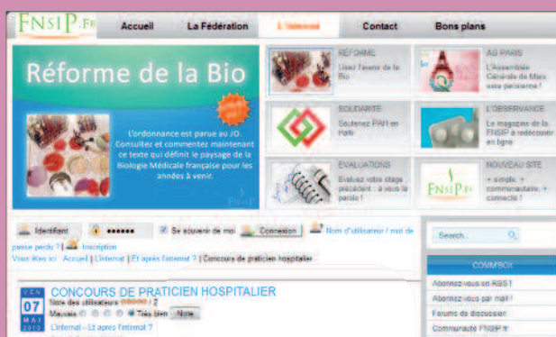
depuis novembre 2009